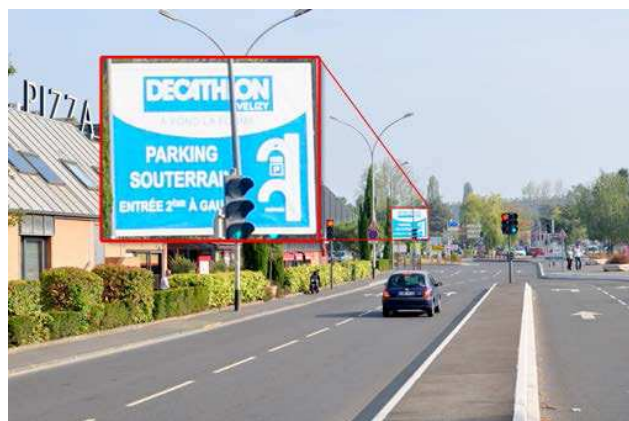
Hikvision Turbo analogová kamera