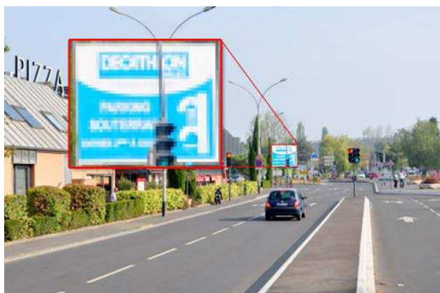
Konvenční analogová kamera

Turbo HD analogové řešení nabízí real-time HD video výstup HD1080p / HD720p s max. snímkovou rychlostí 60sn/s. Uživatelé analogových systémů nyní díky tomu mohou využít výhody kvalit HD video snímku.