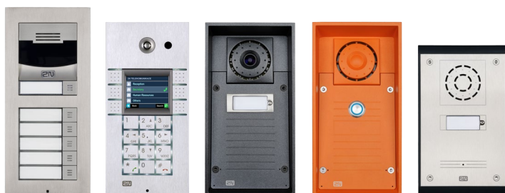
2N® Helios IP Verso 2N® Helios IP Vario 2N® Helios IP Force 2N® Helios IP Safety 2N® Helios IP Uni

Skupina 2N® Helios IP je portfolio dveřních interkomů do všech prostředí – ať už bezpečnostní, obchodní nebo nouzová komunikace do různých oblastí. Od jednoduchých aplikací vyžadujících jasnou a jednoduchou komunikaci na jediný IP telefon, až po komplexní komunikační řešení integrované do bezpečnostních a signalizačních systémů nebo IP ústředěn.