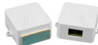
HTemp-1Wire Box2 600 344