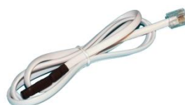
Temp-1Wire 1m 600 242