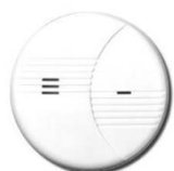
Smoke detector 600 310