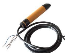
AirFlow detector 5101 600 304