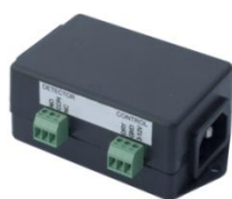
PowerEgg 600 237