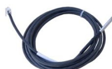
Temp-1Wire-Outdoor 3m 600 311