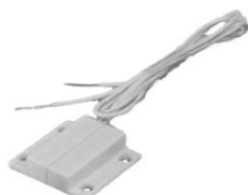
Door Contact 600 119