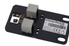
HTemp-Rack19 600 330