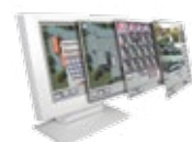
SW Perimeter Security Manager (PSM)