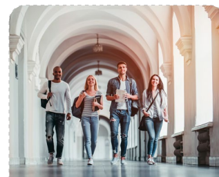
Areál vysoké školy